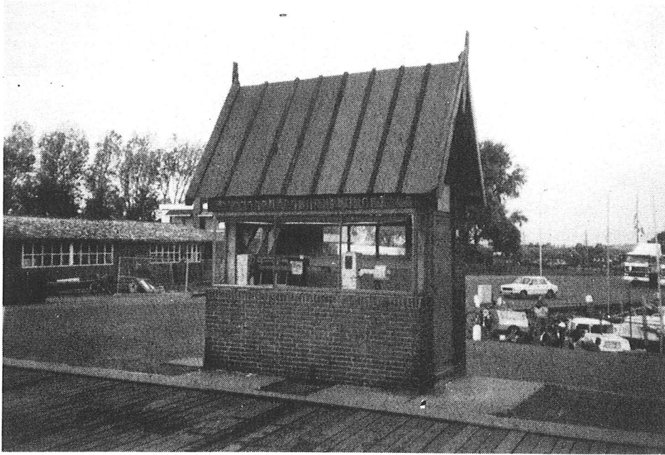
Weegbrug kort voor de sloop.