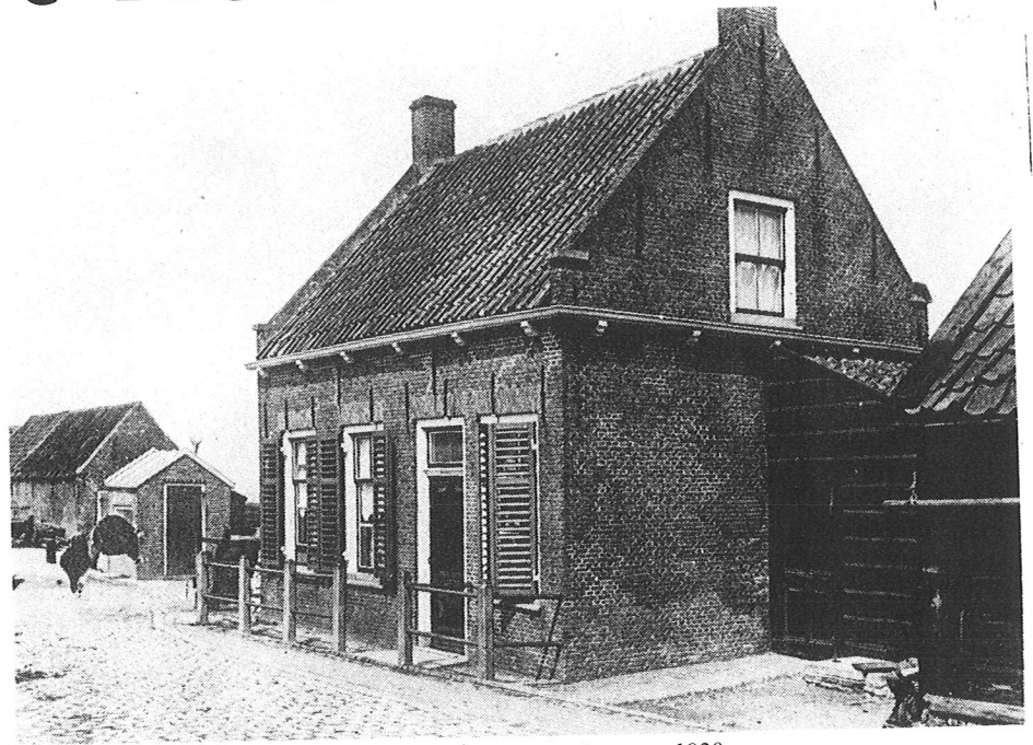
Zeedijk met links de weegbrug ca. 1920.

Ieder, die van de weegbrug wenscht gebruik te maken, zal zich vervoegen bij den weger en verplicht, voor iedere maal dat gewogen wordt, aan hem te betalen, het bij het heffingsbesluit bepaalde weegloon. Door den weger zal een weegbriefje worden afgegeven uit een register met strook, vermeldende het bruto, tarra en netto gewicht en de soort van de gewogen goederen of voorwerpen.